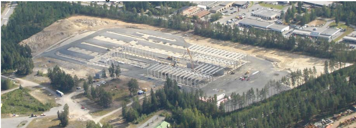
Den nye fabrikk på Arsenalet under oppføring sommeren 2007